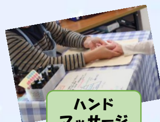
ハンド マッサージ